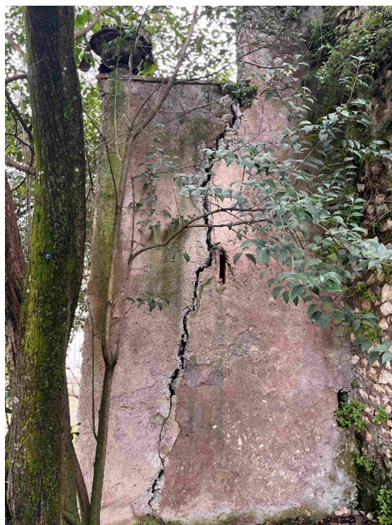
Fig. 2 - 16/02/2026 Fessurazione – dettaglio